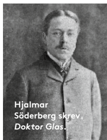
Hjalmar Söderberg skrev Doktor Glas .

Nu lanserar Dramaten ett nytt sätt att uppleva romanen Doktor Glas : en ljudpromenad i Stockholm. Du vandrar till platser där romanen utspelar sig och hör Krister Henriksson berätta. Ladda ner appen Promenad i App Store, pris 59 kr.