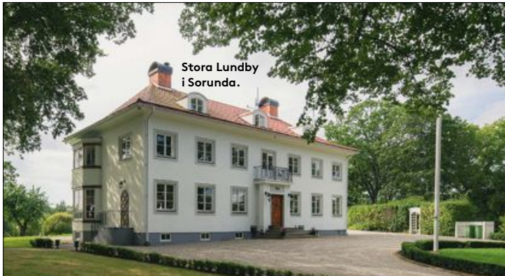
Stora Lundby i Sorunda.